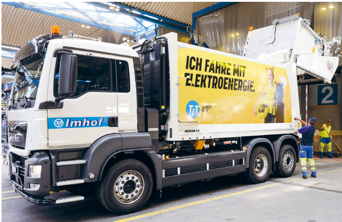
1. Juli 2019: Erster Kehrichtablad bei der KVA in Basel mit vollelektrischem Kehrichtsammler – Im Auftrag der KELSAG unterwegs...